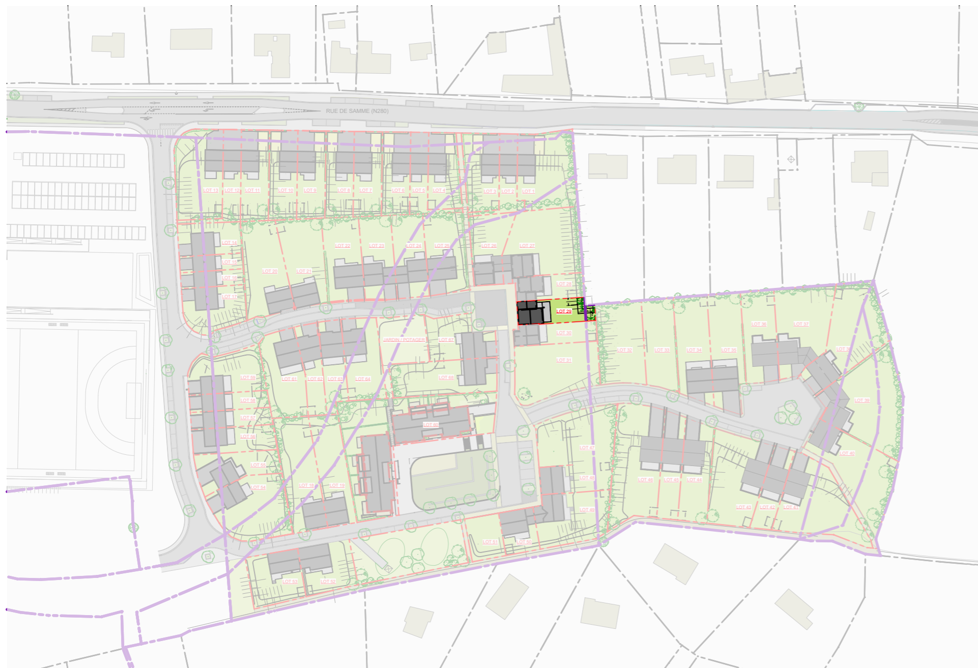
PLAN DE LOTISSEMENT